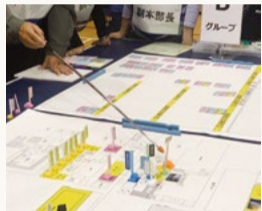
千代田区版図上訓練

本区では区内の病院との連携を図り、災害時に緊急医療救護所を設置する訓練を毎年行っています。東日本大震災などの際に傷病者が病院に殺到し混乱したことを教訓に、医療体制を見直しました。発災後おおむね3日間、災害拠点病院などの敷地内や隣接する場所に緊急医療救護所を設置し、トリアージと軽症者の治療を実施します。避難所の開設および運営については、これまで繰り返し訓練を実施しています。最近では、実際に避難所となる施設の図面を用いた「千代田区版図上