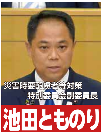
災害時要配慮者等対策 特別委員会副委員長

毎年、決算については決算特別委員会。次年度予算や補正予算については予算特別委員会を設置。