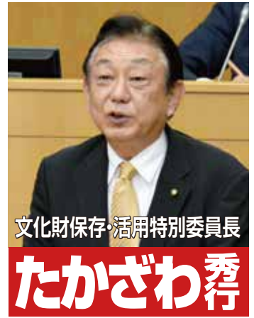
文化財保存・活用特別委員長