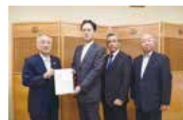
千代田区監査委員 桜井ただし

地方自治法第 233 条第 2 項の規定により、平成 30 年度千代田区各会計歳入歳出決算書、同各会計歳入歳出決算事項別明細書、同各会計実質収支に関する調書、同財産に関する調書及び関係書類を審査した結果、次の通り意見を付します。