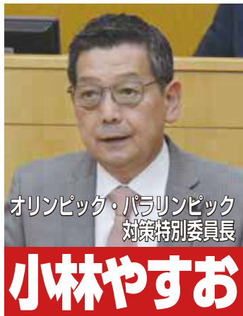
オリンピック・パラリンピック 対策特別委員長