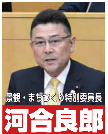
景観・まちづくり特別委員長