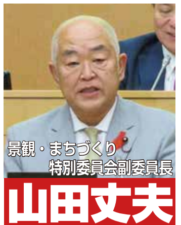
景観・まちづくり 特別委員会副委員長

千代田区では、地域特性を生かした魅力あるまちづくりの創設に向け、区民や事業者など、多様な主体とともにまちづくりに取り組んでいる。住民、企業、行政が協働で進めるまちづくりの方向性を定めた現行の都市計画マスタープランは平成10年に策定され、その目標年次は平成30年（2018年）から令和2年度（2020年度）までとなっている。策定から20年以上が経過する中で、人口の増加、大規模災害のリスクの高まり、ユニバーサル社会の進展、環境に配慮した持続可能なまちづくりの推進など、課題は高度多様化してきた。また、都市化が進んだ千代田区では、老朽化した市街地の機能更新が喫緊の課題となっていることから、平成30年度よりマスタープランの改定作業に着手している。また、緑の基本計画、駐車場整備計画の改定も予定されています。本年4月1日から、区は地域における景観行政を担う景観行政団体へ移行した。景観法に基づき、景観行政団体として景観行政を推進するために、今後、景観計画の策定が必要であり、都市計画マスタープランの改定や諸計画との関連を確認しながら、その進捗状況等を確認していく必要がある。皇居を擁する本区にふさわしく、かつ地域の方々の意見や諸課題を踏まえたまちづくり及び都市景観について、精力的かつ詳細な調査を行うため、特別委員会の設置。〈設置理由要旨〉