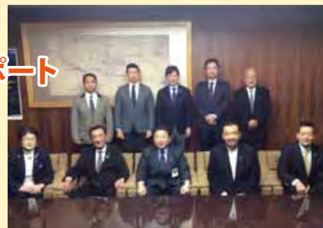
▲いわき市長との懇談(市長室にて)