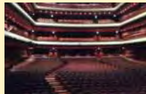
▲いわき芸術文化交流館 アリオス大ホール

自由民主党議員団で東日本大震災で被災したいわき市を訪問視察いたしました。いわき市長との懇談では、今もなお避難している市民が一日でも早く戻ってきてもらえるように復興に向け日々努めている熱い思いに共感し支援を誓いました。