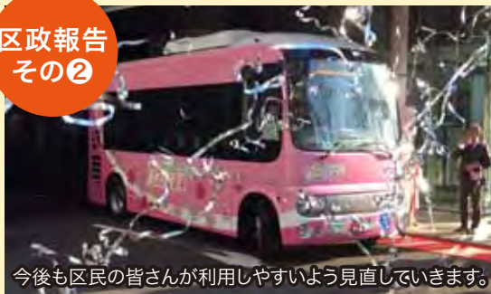
今後も区民の皆さんが利用しやすいよう見直していきます。