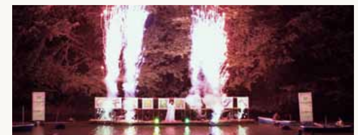
▲千代田区納涼の夕べ

感受性豊かな子どもたちに教科書を通して歴史への愛着、日本人として誇りを持って欲しいという願いを込めて質問しました。改正道交法では取り締まりを強化することより危険行為を周知するのが目的だと警察に確認しています。